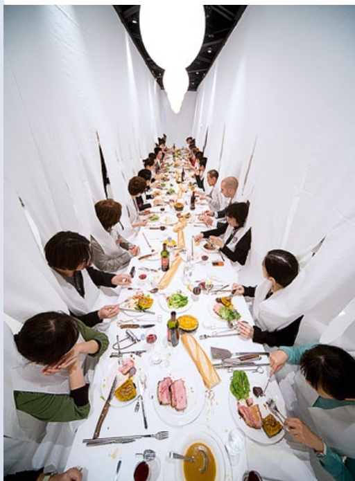
Sharing Dinner, Marije Vogelzang

Najciekawsze są eksperymentalne działania dotyczące jedzenia zarówno jako pokarmu, jak i jako czynności. Działania te i powstające w ich wyniku projekty najczęściej określane są mianem food designu.