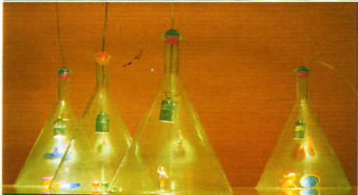
Para que tus objetos favoritos resalten aún más, Collector.