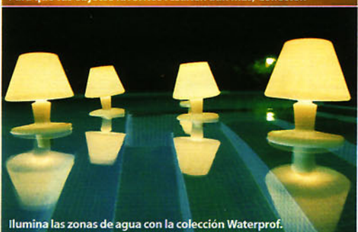
Ilumina las zonas de agua con la colección Waterproof.