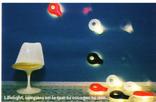
Lifelight, lámpara en la que tú escoges su uso.

En esta colección, he buscado la esencia