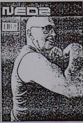
Cartel del estudio (Bis) y portada de la revista Neo2, de Ipsum Planet.

textos y algunas de las piezas, ya fabricadas o en prototipos. Comparten el centro de la sala alfombras de Díez+Díez, carteles de Sonsoles Llorens, una si-